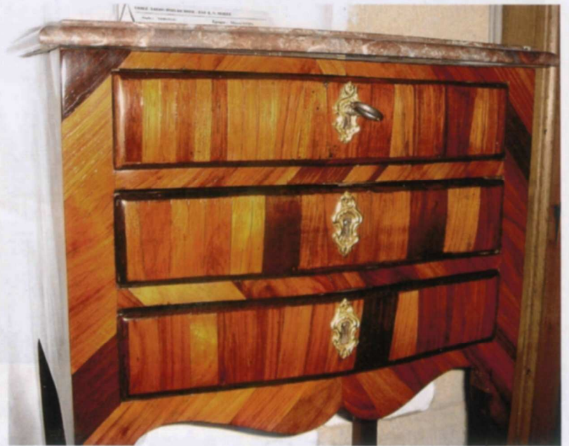
Table de salon estampillée Louis-Noël Malle, reçu Maître en 1765.