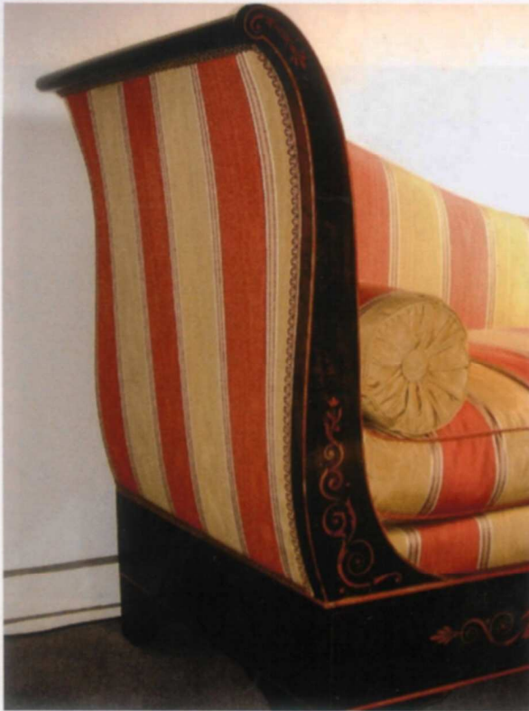
Méridienne en palissandre et sycomore de l'époque Restauration.