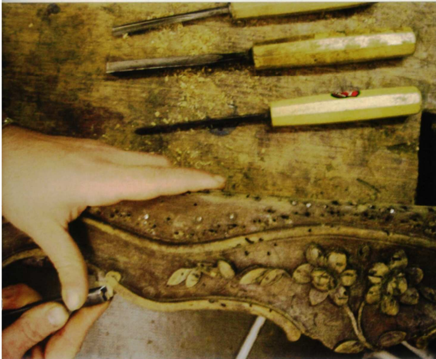
Restauration d'un fauteuil en bois sculpté d'époque Louis XV