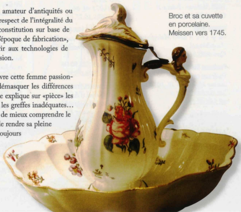
Broc et sa cuvette en porcelaine. Meissen vers 1745.

Rue des Prés 40 à 5316 Contern (Luxembourg). Tél. +352/35.93.84. Site web. www.atelierfrere.lu Portes Ouvertes du 17 au 26 novembre, tous les jours de 14h à 20h.